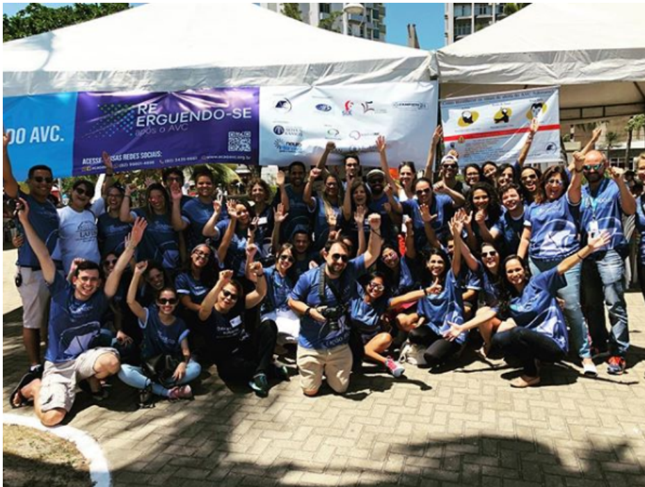
Evento principal da Campanha Mundial do AVC, realizado na Ponta Verde (Rua Fechada)