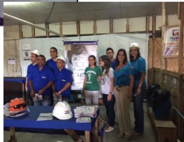
PALESTRAS CANTEIRO DE OBRAS